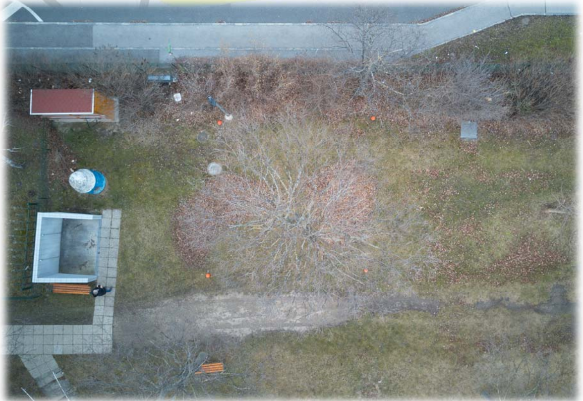
Diese Aufnahme entstand 2019 und die Bojen markieren den Umriss von 8x8 Meter, welcher Planungsstand 2019 war (jetzt 12x8,5 m).